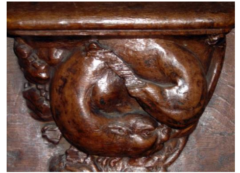
42- Chien se léchant la cuisse