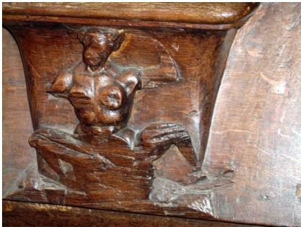
44–femme émergeant d'un baquet