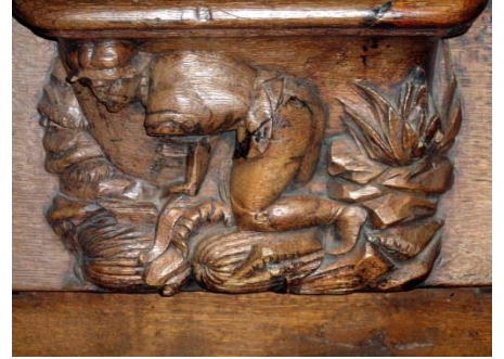
14 – Cultivateur récoltant