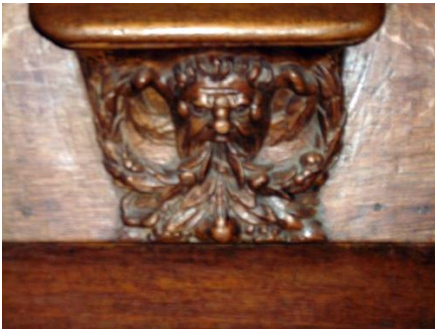
11- personnage cornu