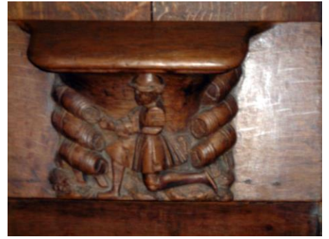
10 – Le Sommelier