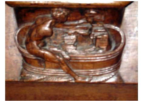
17 – homme et femme se baignant