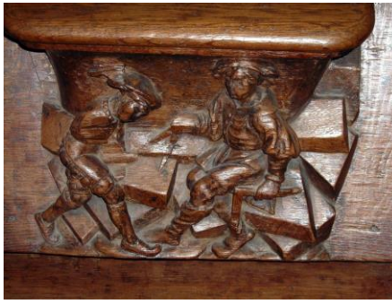
9 – Architecte traçant