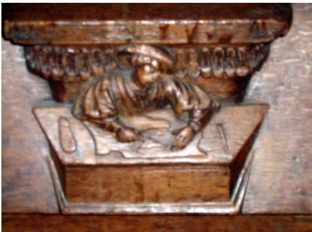
26 - Le Cordonnier