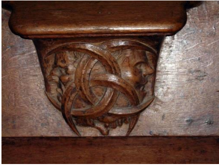
8 - la triple Hécate