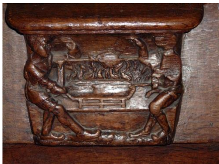
27 – Les rôtisseurs d'oie