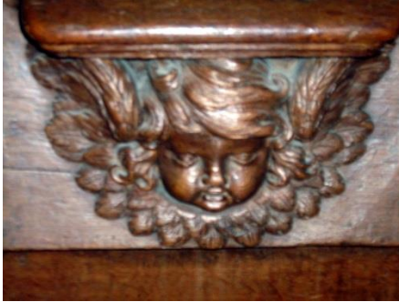
12 – Angelot avec ailes sur les tempes