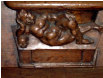
15 – enfant sur un cercueil