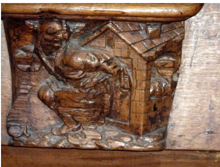
18 – Fou faisant ses besoins