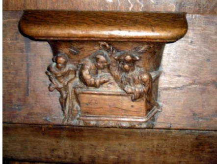
16 – femme qui se confesse