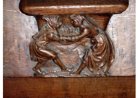
25 – Homme et femme unis par les avant-bras