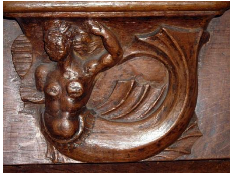
40 – Sirène peignant ses cheveux