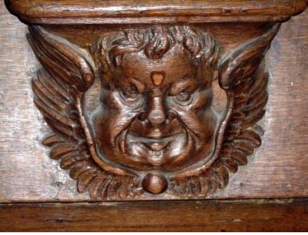
28 & 41 – Angelots avec ailes partant du menton