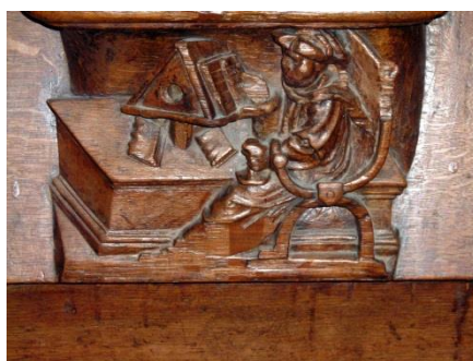
21 – Savant à son pupitre