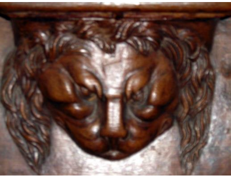
32 & 43 – Têtes de lion